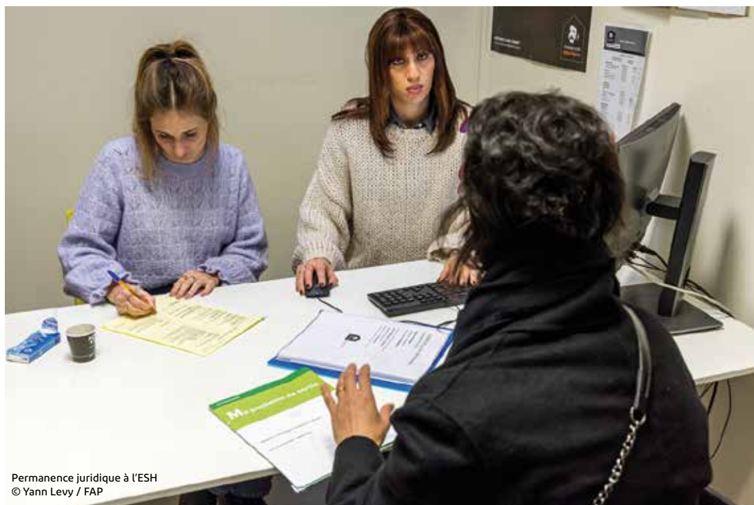
Permanence juridique à l'ESH

154 ménages ont pu trouver une solution de relogement en 2022, notamment dans le parc social, et malheureusement, il n'a pas été possible d'éviter l' expulsion pour 38 d'entre eux.